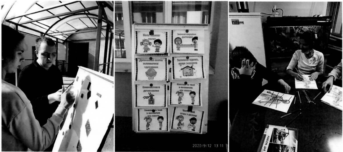
Використання наглядних матеріалів під час проведення курсу

7. Ознайомити з Конвенцією ООН про права осіб з інвалідністю, визначенням та порушенням репродуктивних та сексуальних прав.