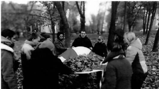
На прогулянці в парку

У рамках проекту проводилися також заходи дозвілля, максимально наближених до загальноприйнятих, з урахуванням особливостей отримувачів соціальної послуги.