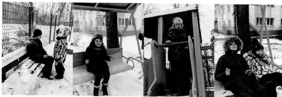
На ігровому майданчику взимку

Важливим напрямом реалізації проекту була інформаційна кампанія щодо діяльності ГО «І «Родина», яка здійснюється через публікації на сайті та своїй організації у Фейсбук, щодо принципів роботи недержавної організації та реалізацію проекту з надання корекційно-розвиткових занять для дітей з інвалідністю підгрупи А.