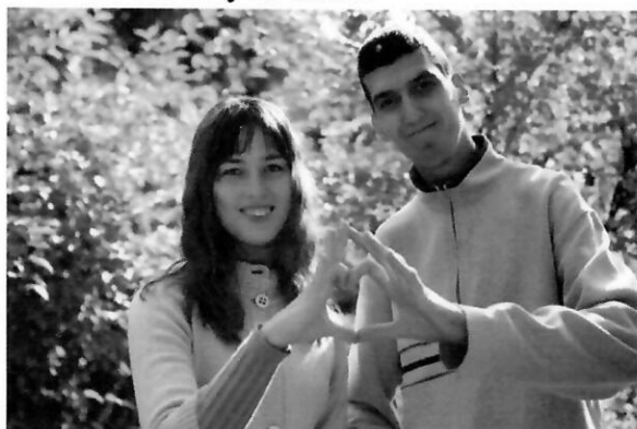
Слухачі курсу «Право на любов»

Згідно з вищезазначеним для молоді віком від 18 років було проведено навчальний курс 'Право на любов' з питань сексуального та репродуктивного здоров'я та прав, призначений для молоді з інтелектуальними порушеннями, як складова соціальної послуги «соціальна адаптація». Перед початком занять за курсом були проведені збори з майбутніми слухачами та їх законними представниками з метою інформування про зміст курсу та надання відповідей для запитань, отримання інформаційної згоди на проходження курсу. По завершенні курсу батьки отримали рекомендації від ведучого для підтримання набутих навичок слухачами.