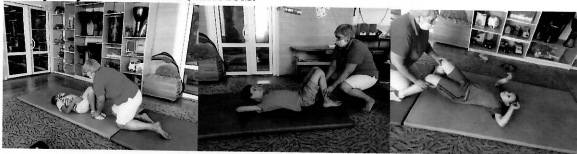
Фізичні вправи під час денного догляду

дитини розроблено індивідуальну програму розвитку. Таким чином, батьки мають можливість вдома тренувати здобуті навички з дитиною, а згодом проконсультуватися зі спеціалістом.