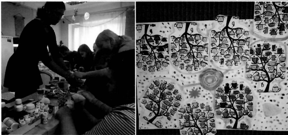
Творчі заняття з використанням придбаних матеріалів