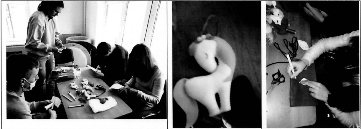
Молодь готує вироби з фетру під час занять з працетерапії

Із законними представниками молоді та підлітків були підписані договори про надання послуг в ГО «Родина», для кожного клієнта проекту розроблено індивідуальний план надання послуг в Центрі, де зазначені усі заняття та інші види діяльності протягом часу, коли молода людина чи підліток знаходиться в «Родині». Законні представники мали можливість обговорювати з фахівцями процес отримання послуги «соціальна адаптація», можливості та досягнення своїх підопічних, а також поспілкуватися між собою.