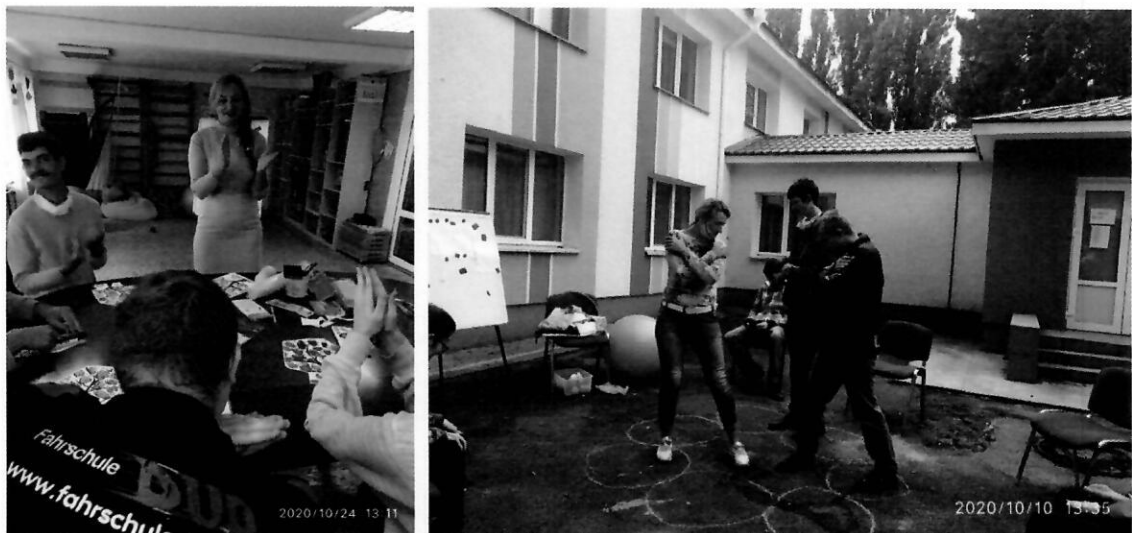
Руханки і перерви під час занять