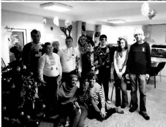
Святкування нового року