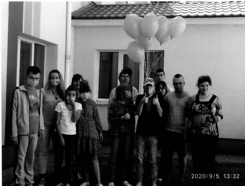
Учасники проекту – молодь ГО «Родина»