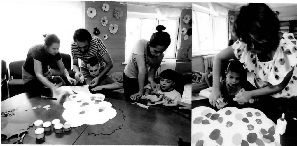
На занятті з арт-терапії