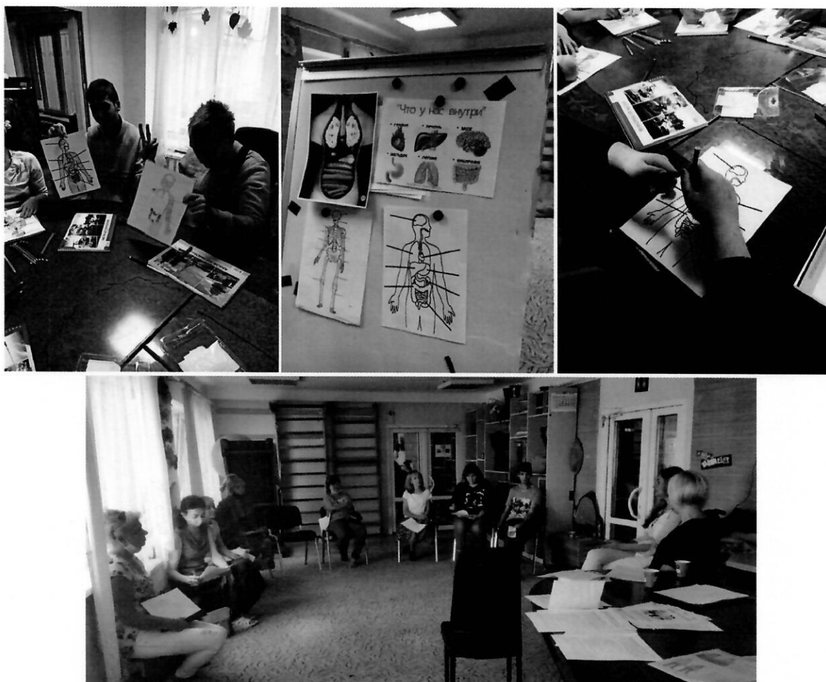
Заняття курсу «Право на любов»

Заняття відбувалися у доступній для кожного клієнта формі з використанням роздаткових матеріалів та наглядності.