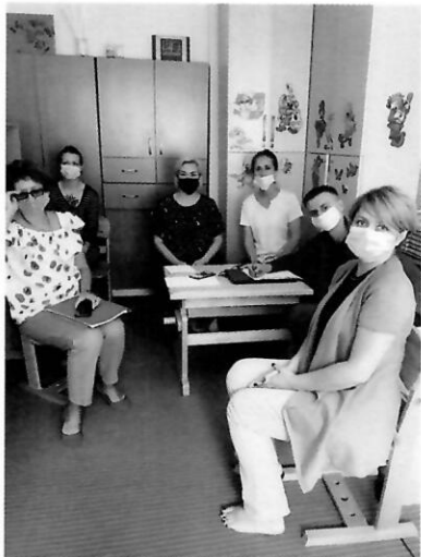
Засідання мультидисциплінарної команди із залученням батьків

У рамках реалізації проекту застосовувався комплексний підхід для організації підтримки сімей, які мають дитину з важкою формою інвалідності, що дозволяє попередити інституціоналізацію таких дітей. Так, корекційно-розвиткові послуги надавалися на базі послуги денного догляду для дітей з комплексними порушеннями розвитку і включали в себе три напрямки занять для дітей, а також консультативно-інформаційну підтримку батьків. Крім того, батьки брали безпосередню участь в оцінці потреб і визначенні конкретних розвиткових цілей для дітей, розробці індивідуальних планів надання послуг і програм розвитку дітей. Їх запрошували на засідання мультидисциплінарної команди, надавалися поради щодо програми роботи з дитиною вдома.