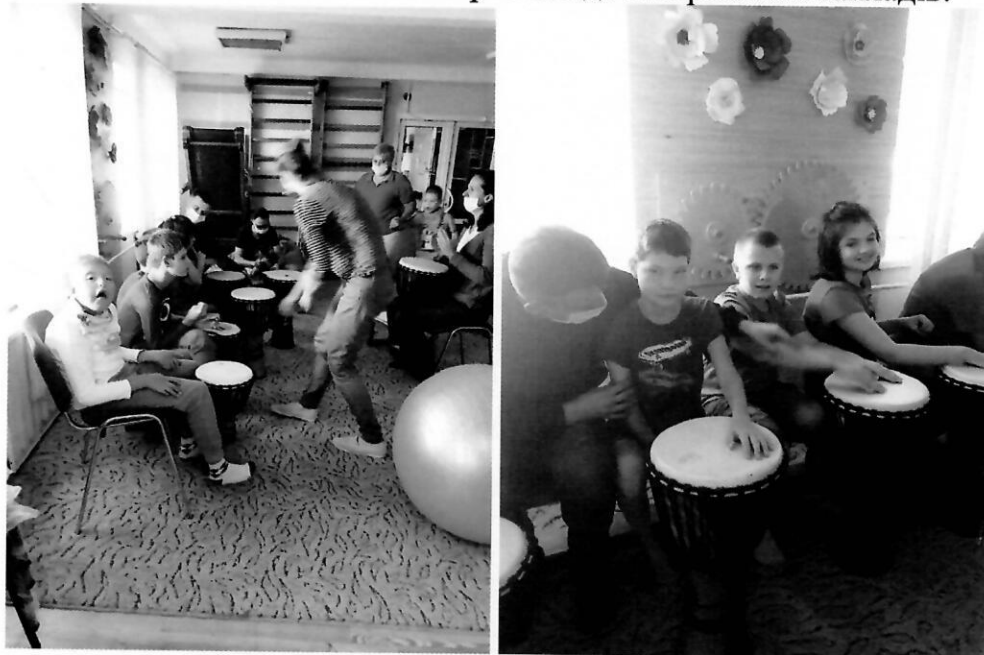
Групове заняття з музико-терапії

Корекційно-розвиткові заняття з дітьми, які мають інвалідність, вкрай важливі для їхнього розвитку, адже є шляхом досягнення автономії, окрім академічних навичок формують навички спілкування, самообслуговування, поведження в громадських місцях тощо. Дітям з інвалідністю підгрупи А такі заняття потрібні регулярно і на постійній основі. Сім'ї дітей з інвалідністю також потребують послуг підтримки. Зазвичай навіть найближчі родичі таких дітей не мають необхідних навичок та вмінь, щоб проводити з ними підтримуючі заняття вдома. Тому, часто у таких дітей стається регрес вмінь, а у батьків – знецінення своїх сил та звернення до інтернатних закладів.