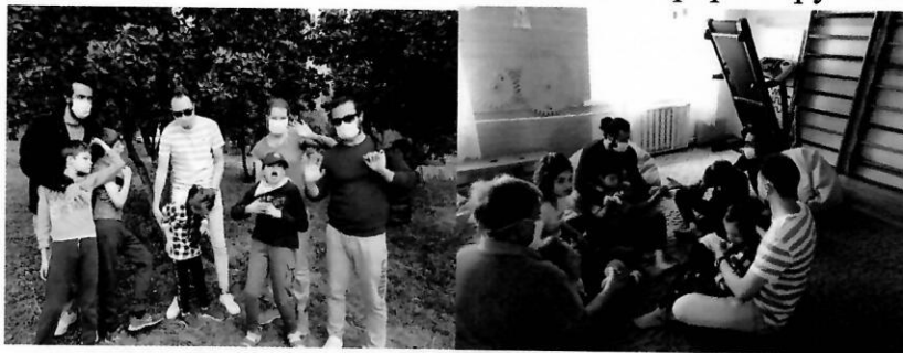
Волонтери з Турції та Франції асистують під час групових занять та прогулянок

Крім того, до надання послуг денного догляду залучалися волонтери міжнародних молодіжних організацій. Вони допомагали організувати прогулянки, харчування і догляд за дітьми під час перерв і групових занять.