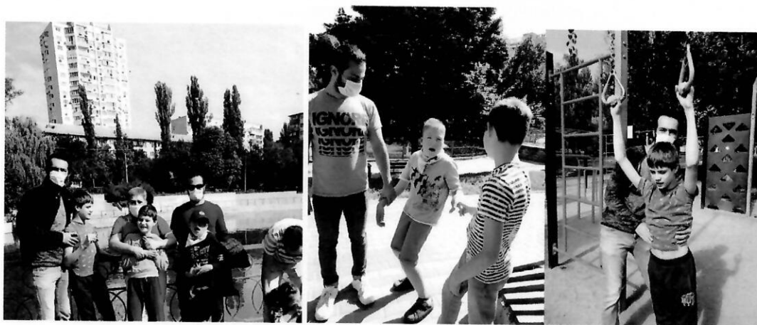
Прогулянки найближчим парком