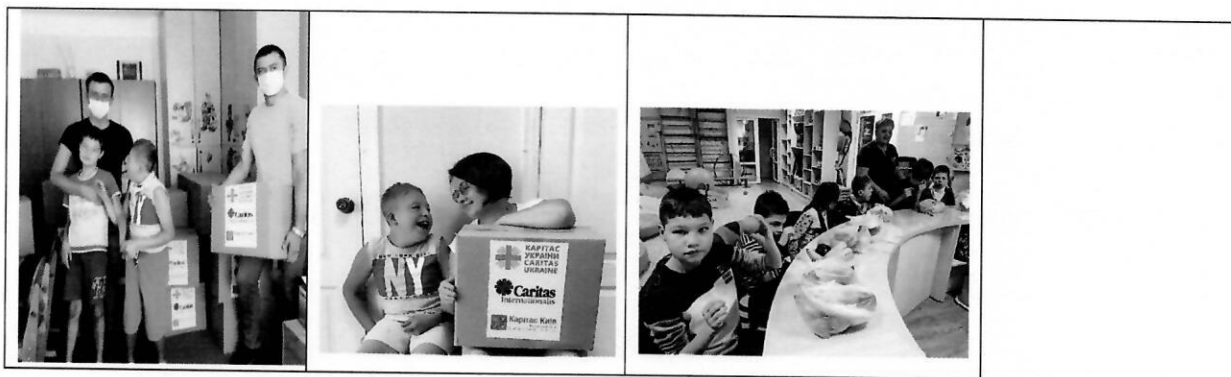
Діти приймають благодійну допомогу