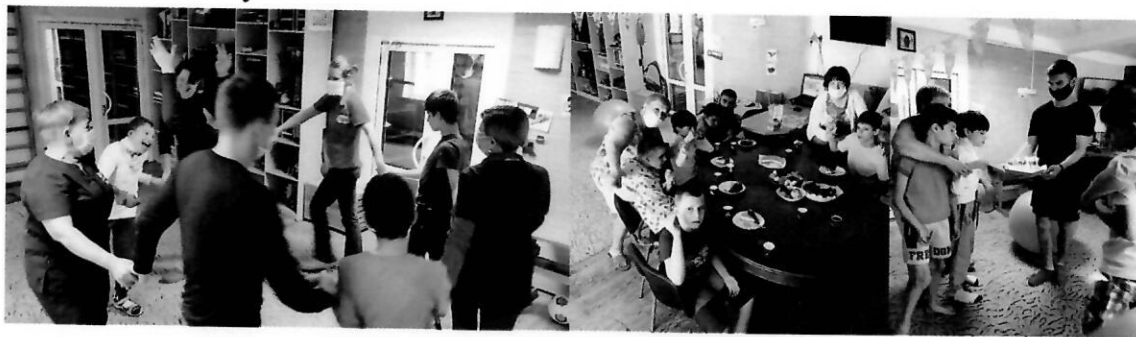
Святкування днів народжень в Центрі

В рамках проекту проводилися також заходи дозвілля, максимально наближених до загальноприйнятих, з урахуванням особливостей отримувачів соціальної послуги.